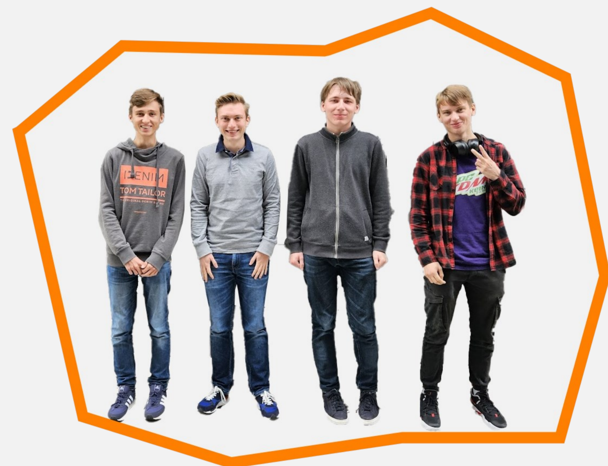
Abb. 1: Das Team