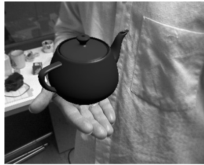
(b) erweitertes Bild

Abbildung 1.1 Beispiel für Bilder, mit Beschreibung. Für nicht selbst erstellte Bilder, die nicht Public Domain sind, ist eine Quellenangabe erforderlich. Bilder aus [Sch01]