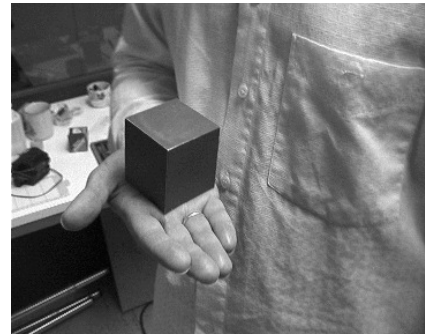
Abbildung 1.3 Beschreibung neben dem Bild mit fcapside. Für Tabellen wird tcapside verwendet

Abbildung 1.2 Beschreibung neben dem Bild mit fcapside. Für Tabellen wird tcapside verwendet