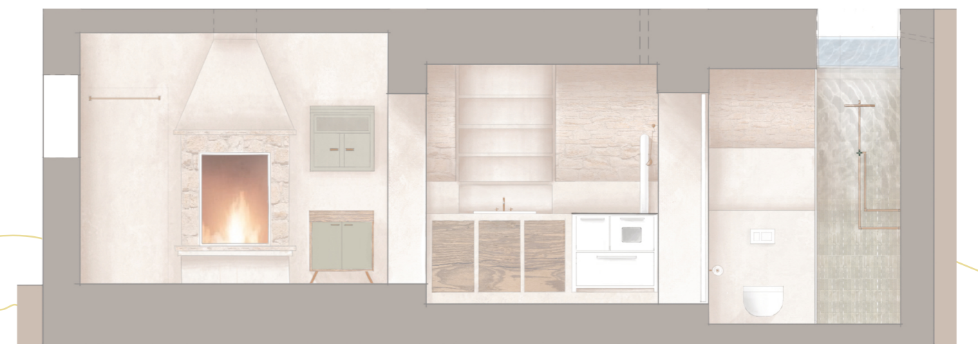
schnitt a-a m 1:50