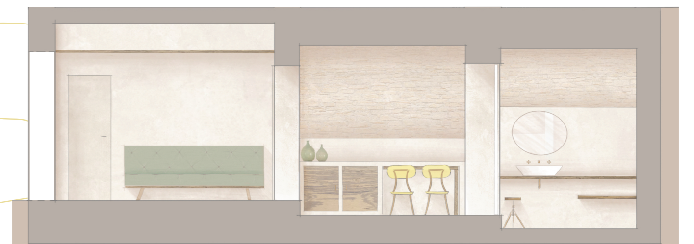
schnitt b-b m 1:50