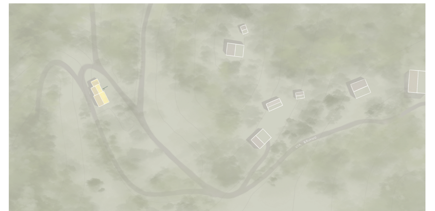
lageplan m 1:2000

besonders beeindruckend ist das geplante oberlicht über der dusche, das mit wasser gefüllt ist und einen magischen lichteffekt im gesamten raum erzeugt.