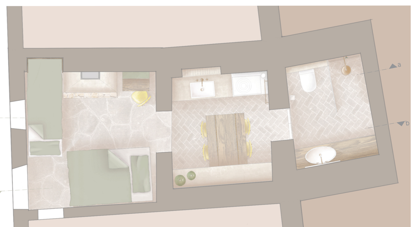
grundriss variante 2 personen + 2 gäste m 1:50 ↗

der entwurf mit begrenztem raum von etwa 20m 2 legte besonderen wert auf die modularität in der möbelplanung. mit wenigen handgriffen kann der grundriss angepasst werden, um zusätzliche schlafmöglichkeiten und sitzplätze für bis zu vier personen zu schaffen. jedes möbelstück wurde bis ins kleinste detail entworfen und ausgefeilt. das ergebnis ist ein grundriss mit großer modularität und flexibilität, der den begrenzten raum optimal nutzt und den bewohnern ermöglicht, den innenraum je nach bedarf anzupassen.