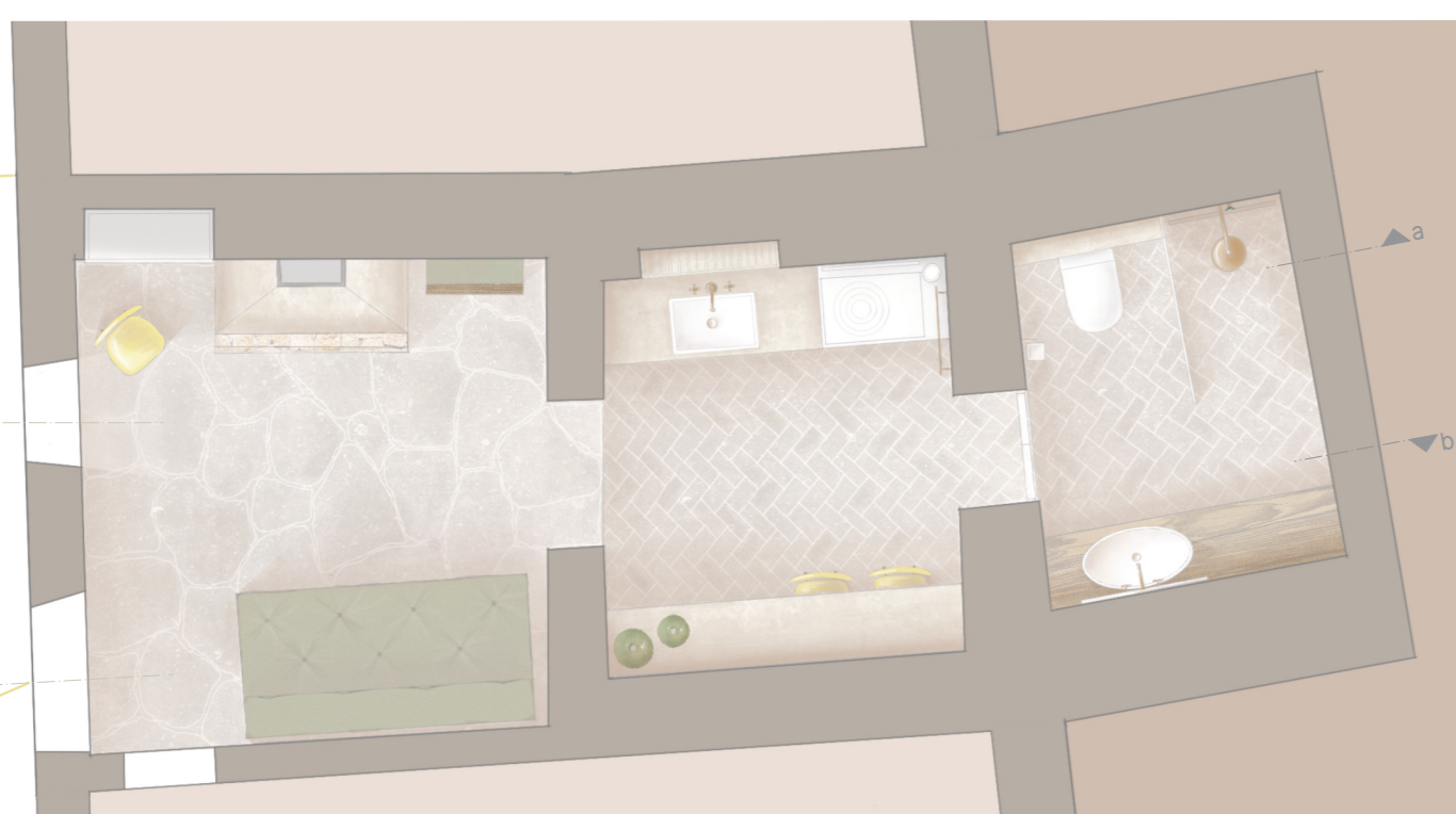
grundriss variante 1 person m 1:50 ↗

der entwurf mit begrenztem raum von etwa 20m 2 legte besonderen wert auf die modularität in der möbelplanung. mit wenigen handgriffen kann der grundriss angepasst werden, um zusätzliche schlafmöglichkeiten und sitzplätze für bis zu vier personen zu schaffen. jedes möbelstück wurde bis ins kleinste detail entworfen und ausgefeilt. das ergebnis ist ein grundriss mit großer modularität und flexibilität, der den begrenzten raum optimal nutzt und den bewohnern ermöglicht, den innenraum je nach bedarf anzupassen.