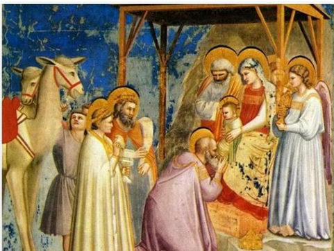
Fresco von Giotto di Bondone (1303), Scrovegni Chapel: Adoration of the Magi